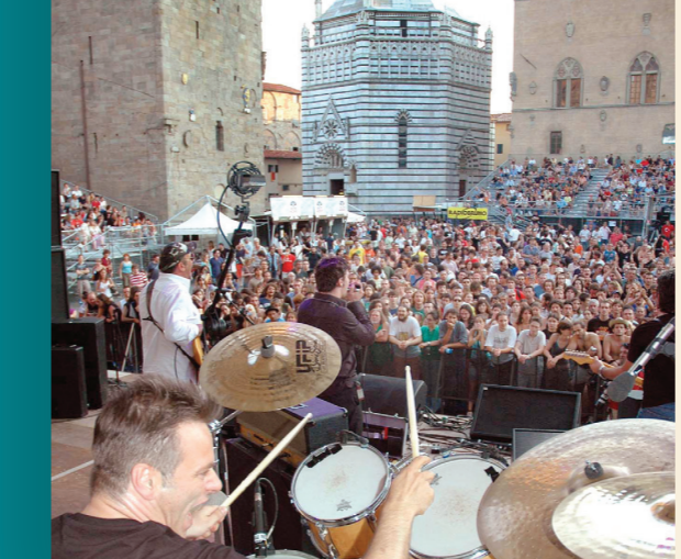
Pistoia Blues, uno dei principali eventi blues del mondo

ed inizia la parte liturgica della manifestazione. Nella notte si rinnova l'antica e appassionante gara tra i cavalieri.