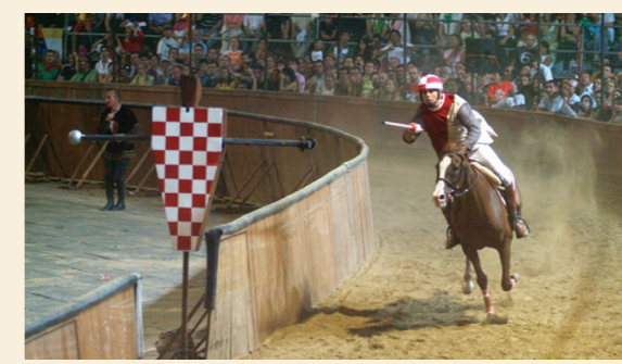
In copertina: il Campanile e la Cattedrale

DA DICEMBRE A GENNAIO CELEBRAZIONE DEL NATALE Concerti, mostre e mercatini allietano la città nel periodo natalizio e culminano il 6 gennaio nella tradizionale Festa della Befana, che viene fatta calare dal Campanile nella piazza del Duomo gremita di spettatori.