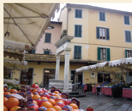
Piazza della Sala

14 Piazza della Sala Era il centro della città longobarda. Poi la piazza assume e consolida un'altra funzione, quella commerciale,