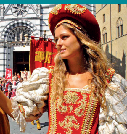
Il corteggio storico si snoda nelle strade della città il 25 luglio, Festa di San Jacopo