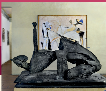
L'interno del Museo Marino Marini e, a lato, il Pulpito di Giovanni Pisano nella Chiesa di Sant'Andrea

è decorato da medaglie di Benedetto Buglioni e Giovanni della Robbia (1515-1529) e dal fregio con le Opere di Misericordia , composto da sette formelle in terracotta invetriata policroma. Le prime sei scene furono eseguite da Santi Buglioni (1526-1529), mentre l'ultima, con invetriatura imperfetta, fu realizzata negli anni 1583-1587 da Filippo Paladini. Una formella rappresenta l'Accoglienza dei Pellegrini.