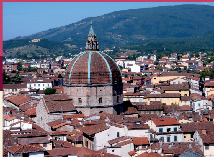
La maestosa cupola della Basilica della Madonna dell'Umiltà

romano e del gotico. Il portale a cuspidi, nella lunetta presenta una statua di San Paolo e nella cuspidi superiore una statuina di San Jacopo.