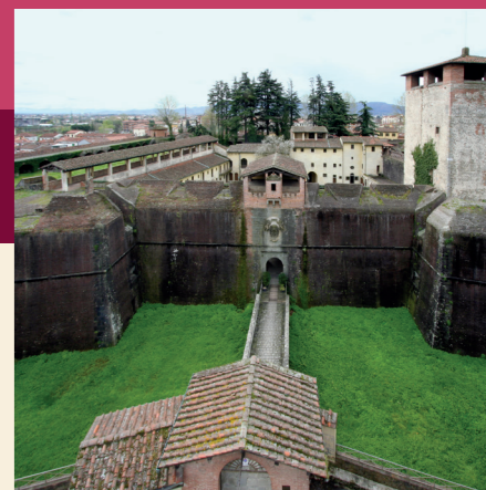
La Fortezza di Santa Barbara

In via Ripa del Sale, il Palazzo dove si dice che abbia soggiornato Clemente IX, ospita