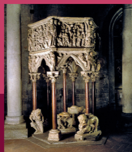
Anche Pistoia partecipa lungo le strade medievali, allo sviluppo del Romanico con sue caratteristiche originali, l'uso delle colonne, degli archi, dei rilievi scolpiti negli architravi e soprattutto la decorazione delle facciate con due colori che caratterizzano le chiese di Sant'Andrea, San Bartolomeo in Pantano, San Pier Maggiore, San Giovanni Fuorcivitas.

11 Chiesa di San Bartolomeo in Pantano Ha origine longobarda e mantiene