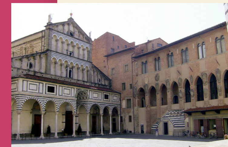
Una veduta della Piazza del Duomo con la Cattedrale e l'Antico Palazzo dei Vescovi

29 Complesso Monumentale di San Lorenzo Il monumento in stile gotico conventuale pistoiese presenta un elegante chiostro rinascimentale.