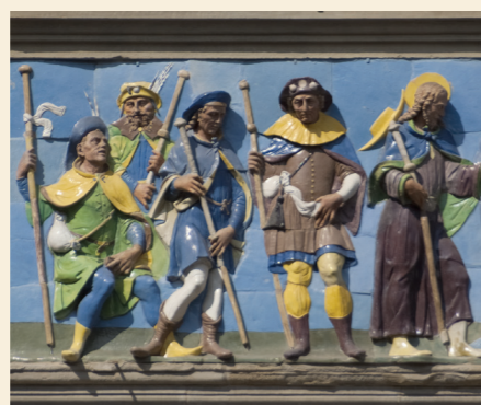
Accoglienza dei pellegrini, particolare, formella che decora il loggiato dello Spedale del Ceppo

10 Spedale del Ceppo L'ospedale, già esistente nel XIII secolo, presenta un loggiato, di ispirazione brunelleschiana, compiuto fra il 1512 e il 1517