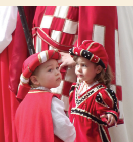
Bambini alla sfilata storica