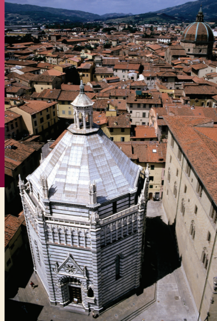
Il Battistero di San Giovanni in Corte

9 Ex Convento del Tau Il convento, sorto nella seconda