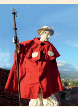
Uno dei momenti più sentiti per i cittadini pistoiesi: la vestizione di San Jacopo