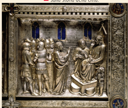
Particolare dell'altare argenteo di San Jacopo custodito nella Cattedrale

Da porta Sant'Andrea il viaggiatore ed il pellegrino, visitati i luoghi iacopei pistoiesi, si dirigevano a Nord, verso i valichi appenninici, percorrendo la via più importante dell'alto medioevo, la via Francigena della Sambuca. Anche a Sud, Pistoia era collegata alla più importante arteria di comunicazioni stradali europee del medioevo, la via "Francigena", che verso Roma, attraversava l'Arno a Fucecchio ed era parte del sistema dei "cammini di Santiago".