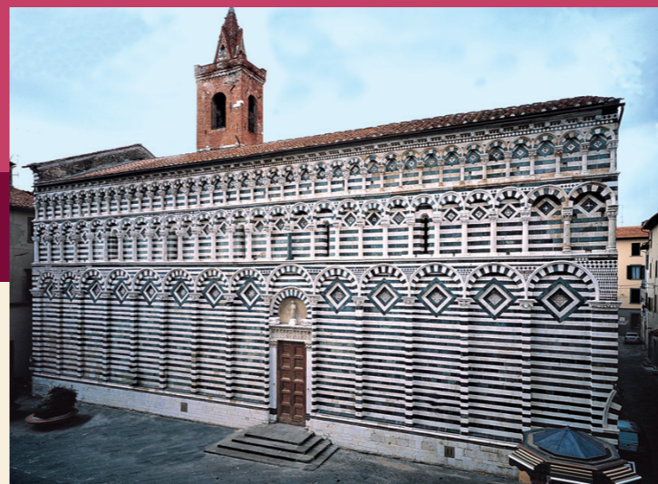
La Chiesa di San Giovanni Fuorcivitas

l'aspetto assunto con i lavori del 1159. La facciata in romanico presenta un architrave scolpito con Cristo e i dodici apostoli . All'interno conserva il pulpito di Guido da Como della metà del '200. Il culto di San Bartolomeo, protettore dei bambini, è molto vivo a Pistoia.